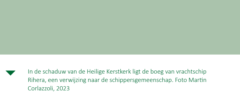
In de schaduw van de Heilige Kerstkerk ligt de boeg van vrachtschip Rihera, een verwijzing naar de schippersgemeenschap. Foto Martin Corlazzoli, 2023

Op het einde van de Sint-Salvatorstraat vind je de Heilige Kerstkerk of Sint-Salvatorkerk. Dankzij zijn ligging vlakbij de oude haven werd deze kerk de ontmoetingsplaats voor de schippersgemeenschap. De boeg van de Rihera, een vrachtschip in 1952 gebouwd bij de scheepswerven van Langerbrugge, symboliseert de nauwe band tussen de schippers en de kerk.