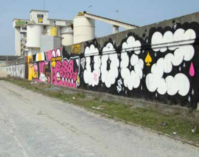
Graffitiewerk op de muren van de intussen gesloopte Inter-Betonfabriek.

De invloed van het modernisme uit het interbellum zinderde nog duidelijk na in de architectuur van de silo's, de zwevende loopbruggen en de wenteltrappen met daarnaast de gele havenkraan die naadloos aansloot op het tweekleurige geheel. Intussen allemaal verleden tijd. In 2009 verhuisde Inter-Beton naar een nieuwe locatie aan de Alphonse Sifferlaan en de betoncentrale zelf verdween in 2021 onder de sloophamer om plaats te maken voor een wijkpark. De gele havenkraan kreeg een nieuwe laag verf en werd groen geschilderd, een verwijzing naar de vroegere kleur van de Gentse stadskranen.