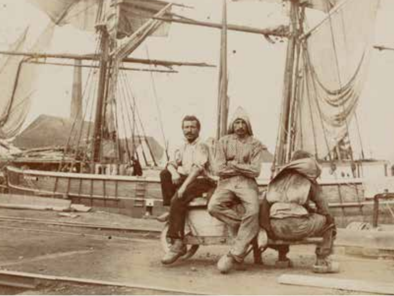
Havenarbeiders die schepen lossen rusten uit op de kade in de Voorhaven.

Op de hoek van Loods 22 vind je een drinkfontein terug waar dokwerkers hun dorst konden lessen. Dokwerkers die geen water maar alcohol dronken, werden 100 jaar geleden linea recta weggezonden "daar een werkmán in dronken toestand een gevaar wordt voor zijne medewerkers", zo klonk het in de dienst- en loonregeling van de Socialistische Dokwerkersvereniging. Zeker als kraanman kon je maar beter niet drinken, want kraanwerk was precisiewerk.