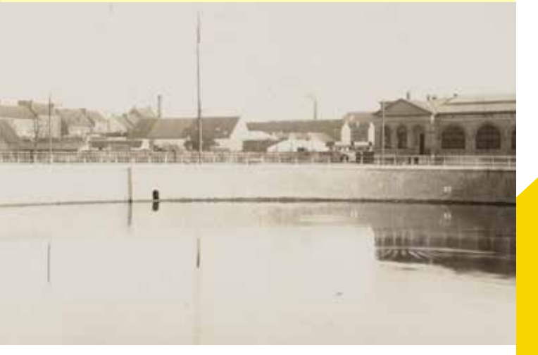
Zicht op de zwaaiikom aan Gent-Dampoort. Op de achtergrond is het goederenstation Gent-Oost, nabij het huidige Dampoortstation, te zien.

Je komt aan het uiterste puntje van de oude Gentse haven, de Zwaaiikom. Daar konden schepen die het Handelsdok wilden verlaten rechtsomkeer maken en het ruime sop kiezen. Binnen-schepen konden via de Zwaaiikom en Portus Ganda dan weer verder varen richting de binnenstad.