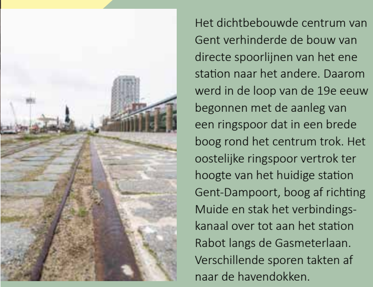
De oude spoorstaven van het vroegere ringspoor zijn nog steeds zichtbaar op de kaaien. Foto Martin Corlazzoli, 2023

Stap verder langs de promenade tot aan de transportkarren, opnieuw een verwijzing naar het havenverleden.