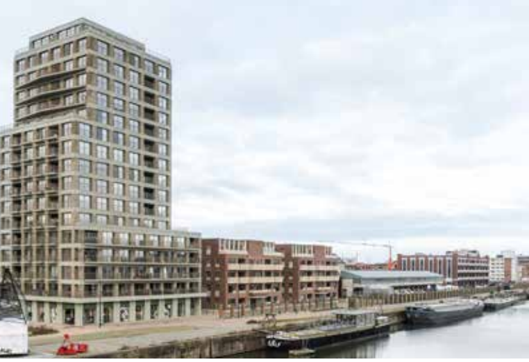
Zicht op de nieuwe woontoren en appartementsblokken, met in de verte het Handelsdokcenter waarop ze gebaseerd zijn. Foto Martin Corlazzoli, 2023

Ter hoogte van de havenkraan liggen rechts verschillende opwindtrommels van vroegere kranen en afgekeurde kettingen van boorplatformen uitgespreid om wildparkeerders te ontmoedigen. Aan de waterkant zijn rode kraanrijers van de Gentse Konstruktiewerkhuizen Eckhout uitgesteld.