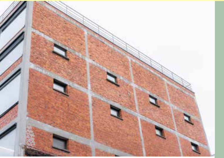
De betonnen balken in de gevel van het pakhuis Dutry-Colson zijn tot op vandaag zichtbaar.

De bakstenen gevel ter hoogte van deze masten is een van de overblijvende pakhuizen aan de Kleindokkaai. Hier stapelde de familie Dutry-Colson zijn suiker, vandaar ook de zware betonnen draagstructuur die zich in de gevel aftekent.