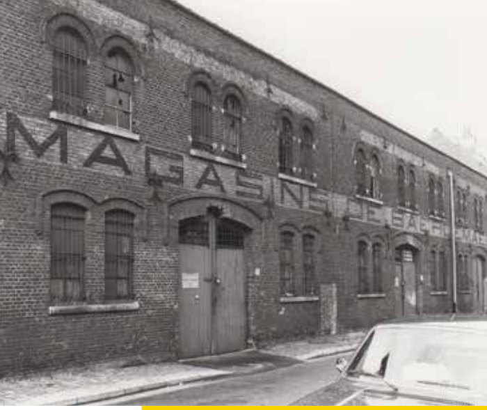
De vroegere gevel van het magazijn van Magasins De Baerdemaecker, 1978.

De Stokerijstraat telde ooit drie streebeluiken. Een beluik is een groep kleine arbeidershuizen rond een ontsloten binnenplaats. Ze werden alle drie gebouwd in de jaren 1880, maar het beluik aan de Bandelierstraat is de enige overlevende. Er pal tegenover trok scheepsmakelaar De Baerdemaecker begin 20e eeuw een magazijn op. Over de volledige breedte van de gevel was de naam 'Magasins De Baerdemaecker' uitgesmeerd. Nu is De Baerdemaecker verdwenen uit het straatbeeld. Nochtans behoorde de scheepsmakelaar sinds de jaren 1850, samen met L'Agence Maritime, John P. Best & Co. en Ghent Trading Company, tot het kranse van grote Gentse havenbedrijven.