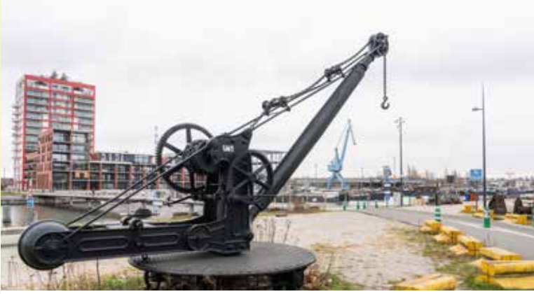
Ter hoogte van Residentie Benelux staat de oudste en kleinste kraan van het Gentse havenlandschap. Foto Martin Corlazzoli, 2023

Jarenlang domineerden havenkranen de skyline van het Handelsdok. Om het maritieme verleden opnieuw tot leven te wekken, werd de voorbije jaren een dozijn havenkranen aangerukt. Ze zorgen niet alleen voor de maritieme sfeer, maar tonen ook de evolutie van de kraantechnologie. Deze handkraan is niet alleen de oudste, maar ook de kleinste van het Gentse havenlandschap. Hij dateert van 1870 en staat geparkeerd op de sporen van een van de oudste kaaien aan het Handelsdok. Nicaise et Delcuve uit La Louvière bouwde hem. Hoewel deze handkraan werd opgevoerd uit een spoorwegdepot in Saint-Ghislain, rolden ook in Gent gelijkwaardige kranen over de sporen om goederenwagons te laden en te lossen. Ondanks zijn manuele aandrijving had de kraan toch een hijsvermogen van drie ton. Het mechanisme werkte na anderhalve eeuw nog perfect, maar werd om veiligheidsredenen geblokkeerd.