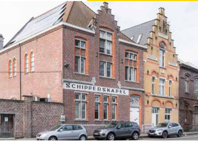
Wie ter hoogte van de Schipperskapel en het Schipperhuis halt houdt en zich omdraait, kijkt uit over het Houtdok en de imposante ST1-kraan.

Onderweg kom je voorbij het Schippershuis en de Schipperskapel. De naam verraadt een kapel die achter de gevels verstoppt zit, maar het Schippershuis fungeerde ook als internaat voor schipperskinderen.