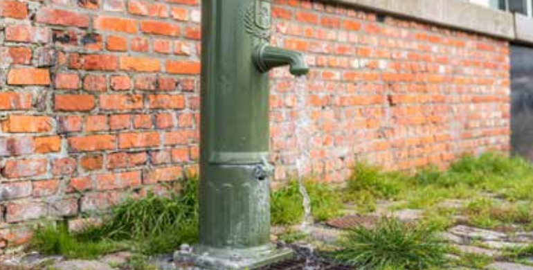
Draai aan het wiel van het fonteinje om water op te pompen.

INDUSTRIEMUSEUM MINNEMEERS 10 8000 GENT www.industriemuseum.be info@industriemuseum.be | 09 323 65 00 #industriemuseumgent