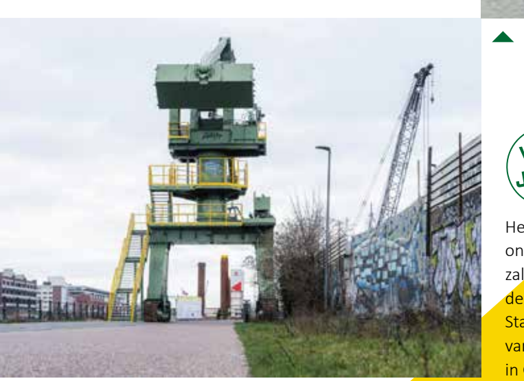
De Sobemai-kraan kijkt vanop de Kleindokkaai uit over het Handelsdok. Foto Martin Corlazzoli, 2023

De Sobemai-kraan komt uit de stal van havenbedrijf Euroports in Gent. Opnieuw een geval apart. Dit is namelijk een hydraulische evenwichtskraan die op rupsbanden rondwalste. Handig dus voor plaatsen waar geen sporen liggen. De kraan werd in 1988 ontwikkeld door Sobemai uit Maldegem, een bedrijf gespecialiseerd in evenwichtskranen. Van op het uitzichtplatform zie je de haven door de ogen van de vroegere kraanmannen.