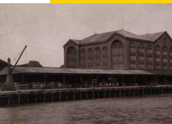
Zicht op het Entrepot aan het Handelsdok dat in 1919 in de vlammen opging.

Op het uiteinde van de Stokerijstraat tekenden zich de contouren af van het Handelsdokcenter. Koning Leopold I legde hiervan de eerste steen in 1844. Het oorspronkelijke gebouw, een ontwerp van de Gentse stadsarchitect Lodewijk Roelandt, ging in 1919 echter in vlammen op. Op de verstevigde funderingen van het oude Entrepot verrees twee jaar later het huidige gebouw: een brandveilig complex waar 10.000 ton goederen konden worden gestapeld, een verdubbeling van de capaciteit. Vandaag herbergt het voormalige stedelijke stapelhuis kantoren. De straat waar je op uitkomt heet trouwens het Stapelplein, een verwijzing naar de oorspronkelijke functie van het Handelsdokcenter.