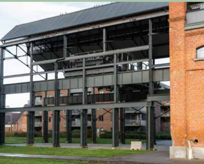
Achter interieurzaak De Directeurswoning is nog een oude rolbrug bewaard gebleven. Foto Martin Corlazzoli, 2022

Dok Noord is een nieuw stadsdeel tussen de historische werkplaatsen van de Ateliers de Constructions Électriques de Charleroi (ACEC), de vroegere fabriek van Carels. Halfweg de 19e eeuw streek Carels, een constructeur van stoommachines, locomotieven, dieselmotoren en gasturbines, hier neer. Om de loodware onderdelen rond te zeulen, bouwde Carels in 1857 als eerste een havenkraan aan het Handelsdok, namelijk een ijzeren handkraan die lasten tot 15 ton kon takelen. Maar ook binnen de fabrieksmuren waren taaiere kranen nodig. Eentje daarvan is bewaard gebleven, namelijk aan de achterkant van de vroegere gietrij, vandaag interieurzaak De Directeurswoning. Bovenop een ijzeren constructie rust daar een rolbrug.